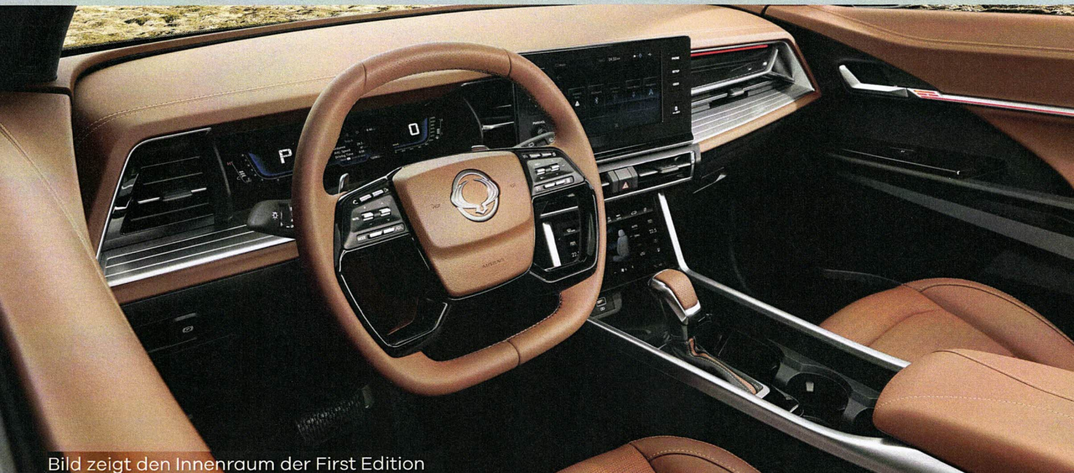
Bild zeigt den Innenraum der First Edition

Der Torres bietet mehr als Sie erwarten!