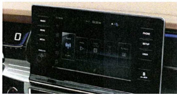
9" LCD (1280*720) mit Rückfahrkamera

* Metallic-Farben im Preis enthalten bei der 1st Edition.