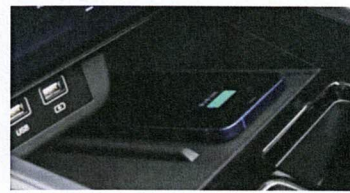
Wireless-Ladestation für das Mobiltelefon