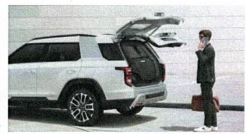
Elektrische Heckklappe mit Komfort-Funktion

Unverbindliche Preisempfehlung inkl. 7.7% MwSt.